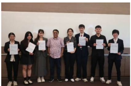
颁发优秀学员证明